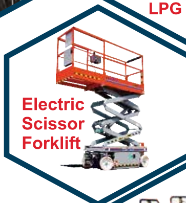
Electric Scissor Forklift