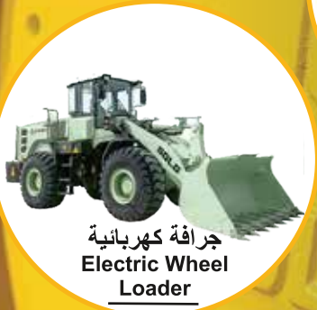
جرافة كهربائية Electric Wheel Loader