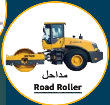
مداحل Road Roller