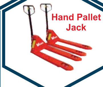
Hand Pallet Jack