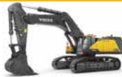
حفارات فولفو Excavators