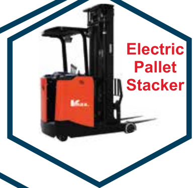
Electric Pallet Stacker