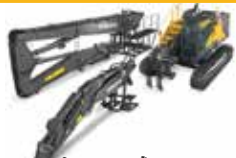
خدمات الصيانة Product Service