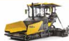
راصفات الأسفلت Pavers