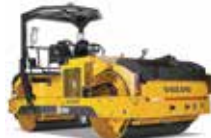
ضاغطات الأسفلت ASPHALT COMPACTORS