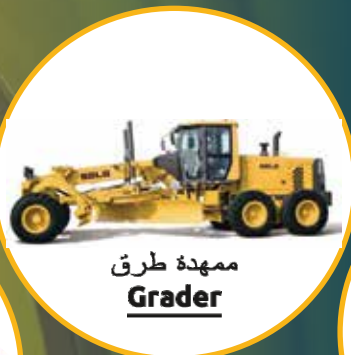
ممهدة طرق Grader