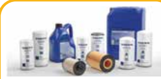
قطع غيار فولفو / Spare Parts / الأصلية