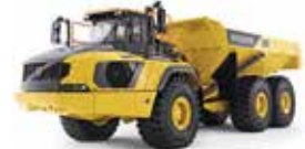
شاحنات النقل / Haulers / المفصلية