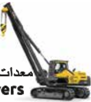
معدات مد الأنابيب Pipe Layers