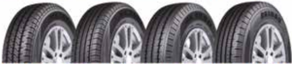
MK1000 MK2000 MK3000 RK1000