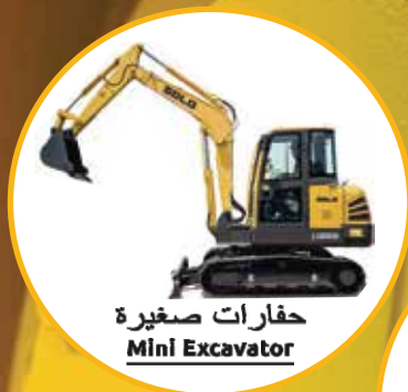
حفارات صغيرة Mini Excavator

Initially founded in 1972, Shandong Lingong Construction Machinery Co., Ltd. (SDLG) is a national large-sized backbone enterprise in construction machinery industry and is listed in Top 100 China's Enterprises in Mechanical Industry and listed as a national-level high-tech enterprise. The leading products include earth-moving scraper and excavator series, road machinery series, mining truck series, and small-sized construction machinery series.