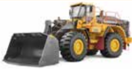
لودر ذات عجلات Wheel Loader