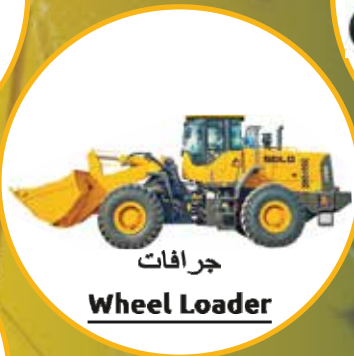
جرافات Wheel Loader